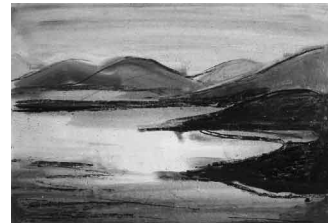
Annemarie Ewertsen, Schottland, am Loch Nes , Aquarell